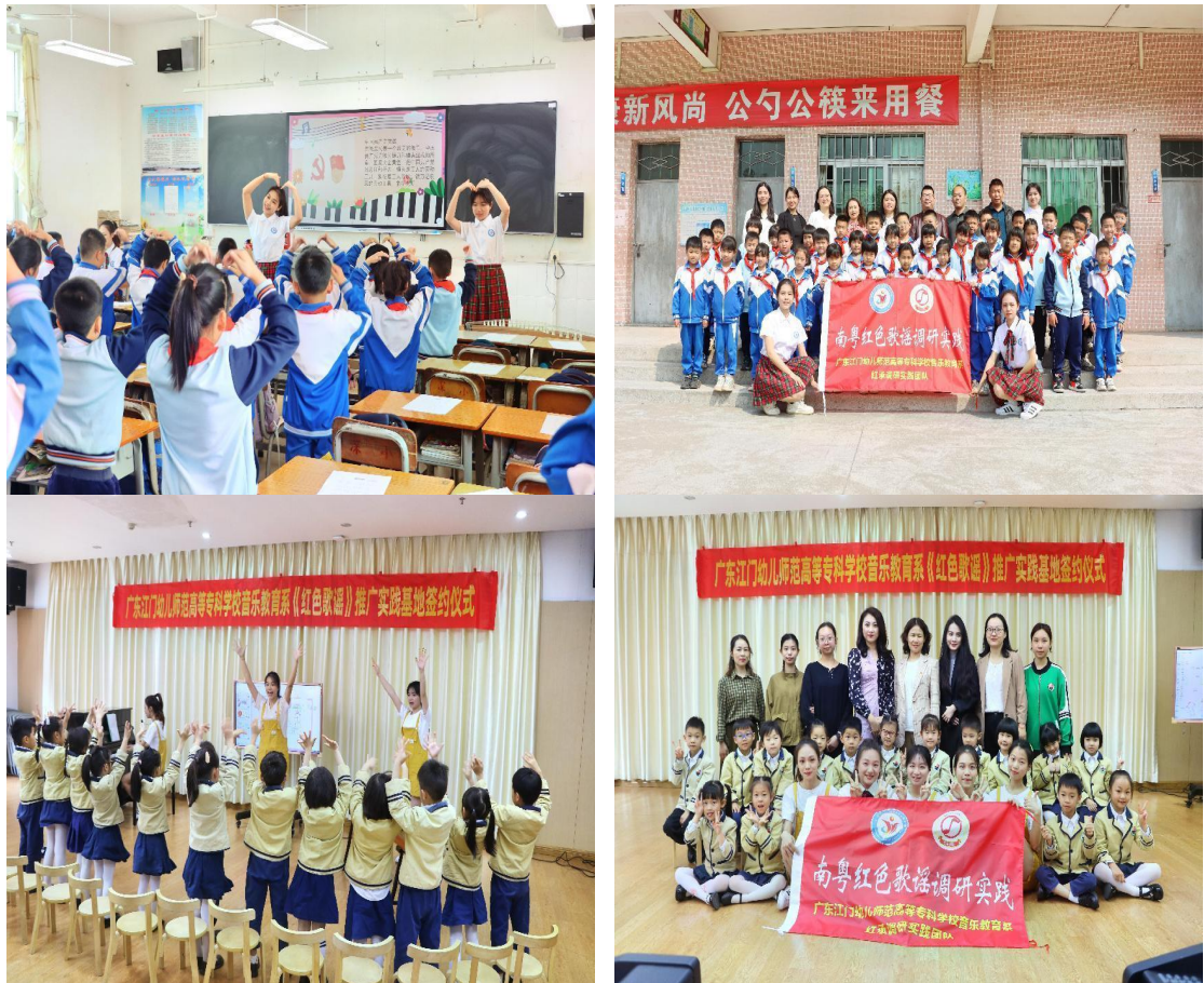
图 17-20：非遗音乐文化调研活动