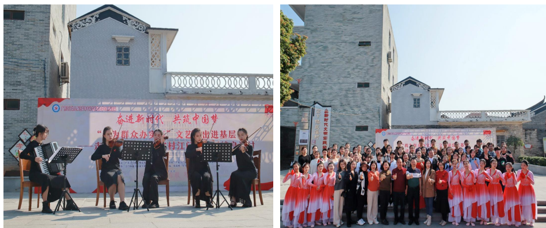
图 21-22：筑梦新时代 奋进新百年“我为群众办实事”文艺演出进基层——走进社会主义新农村江门市棠下镇良溪村

工作，增强新时代大学生的使命担当，提高服务社会的责任意识；贯彻落实“坚持显性教育和隐性教育相统一”的要求，构建音乐艺术课程思政的社会实践模块，创建体验式学习与应用式实践相融合的教育教学模式。2022年1月初，音乐教育系联合马克思主义学院共同开展“筑梦新时代 奋进新百年‘我为群众办实事’文艺演出进基层——走进社会主义新农村江门市棠下镇良溪村”活动。30多名师生参加惠民演出取得圆满成功，获得乡亲们的一致好评。