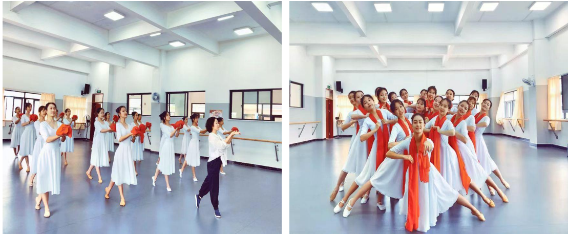
图 15-16：红色歌剧《党的女儿》排练中