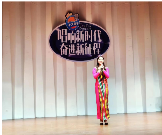
图 3-4：2022 年“唱响新时代、奋进新征程”校园十大歌手大赛