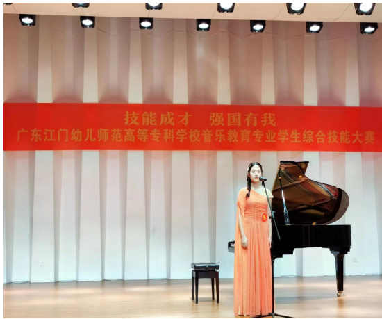
图 1-2：“技能成才，强国有我”音乐教育专业综合技能大赛学生参赛现